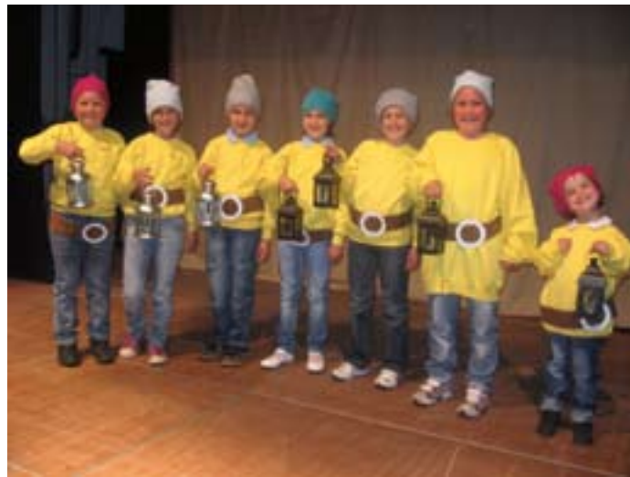
I ‘nanetti’ dello spettacolo Con Pale e con Picconi

e i sette nani”, fiaba tedesca nella quale questi ultimi sono protagonisti proprio come “minatori”, adattata con testi ridotti a recitazione dal maestro Roberto Bazzanella. Grande è stata l’attenzione ed il compiacimento per questa proposta dei giovani coristi-attori del Minicoro che hanno interpretato le varie parti, da Biancaneve, ai piccoli nani, allo specchio magico e alla matrigna, con precisione e comunicatività. Apprezzato è stato anche l’intervento degli