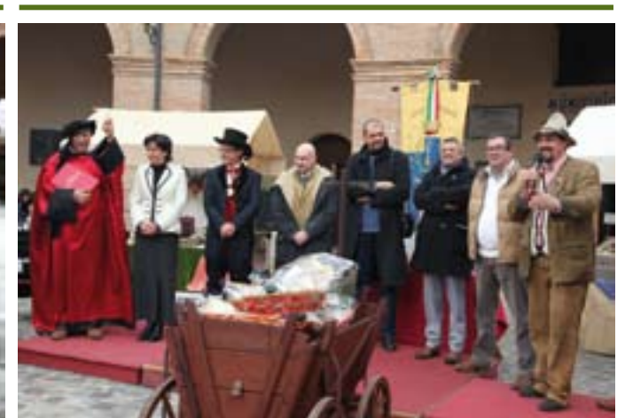
Due momenti della cerimonia a Mondaino. Tra le autorità e gli ospiti anche il grande Alberto Tomba.