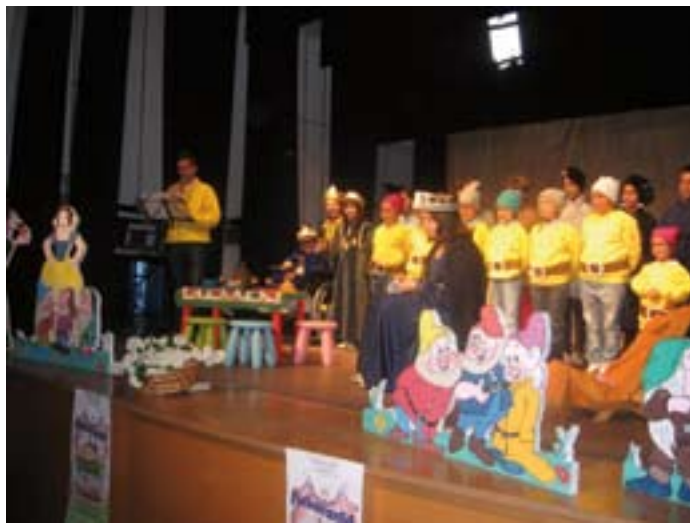
Il Minicoro a 'Con pale e con picconi' al teatro di Casatta

e i sette nani”, fiaba tedesca nella quale questi ultimi sono protagonisti proprio come “minatori”, adattata con testi ridotti a recitazione dal maestro Roberto Bazzanella. Grande è stata l’attenzione ed il compiacimento per questa proposta dei giovani coristi-attori del Minicoro che hanno interpretato le varie parti, da Biancaneve, ai piccoli nani, allo specchio magico e alla matrigna, con precisione e comunicatività. Apprezzato è stato anche l’intervento degli